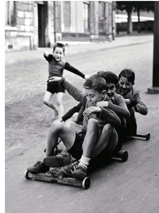
Exemplo de foto antiga