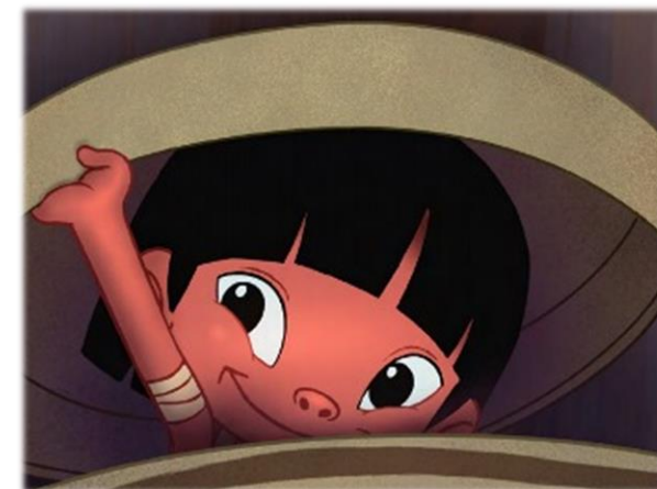
AQUITÃ, O INDIOZINHO: PERSONAGEM DA SÉRIE QUE MEDO! , PRODUZIDA PELA MULTIRIO