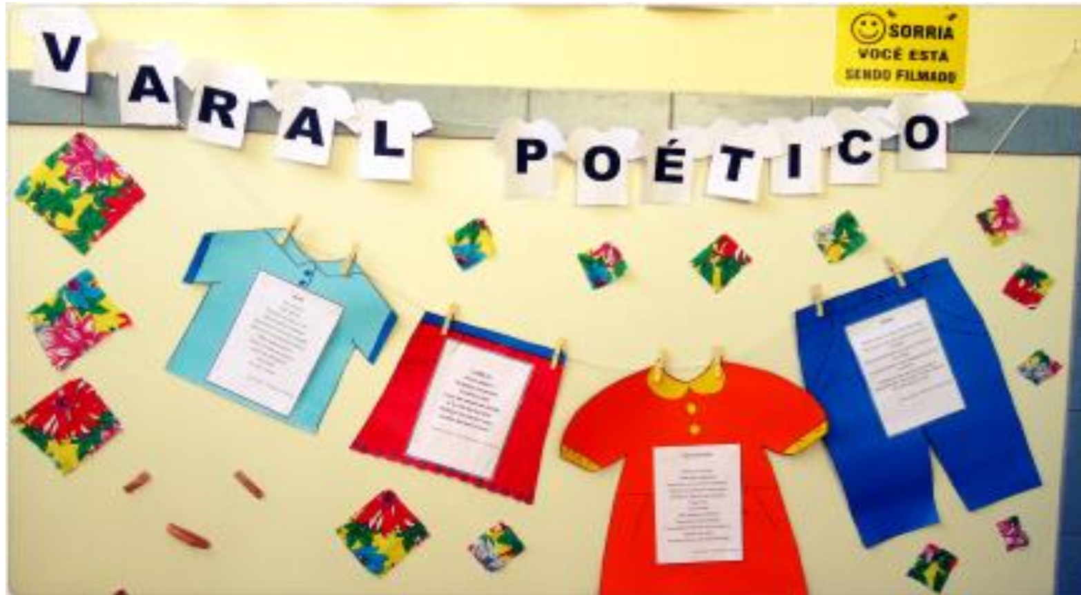
IMAGEM: VARAL POÉTICO | Blog Girassol (wordpress.com)

PENSANDO NISSO, PREPARAMOS UM VARAL POÉTICO PARA VOCÊ LER COM ALGUÉM DA SUA CASA E JUNTOS SE ENCANTAREM!