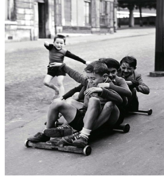
Exemplo de foto antiga