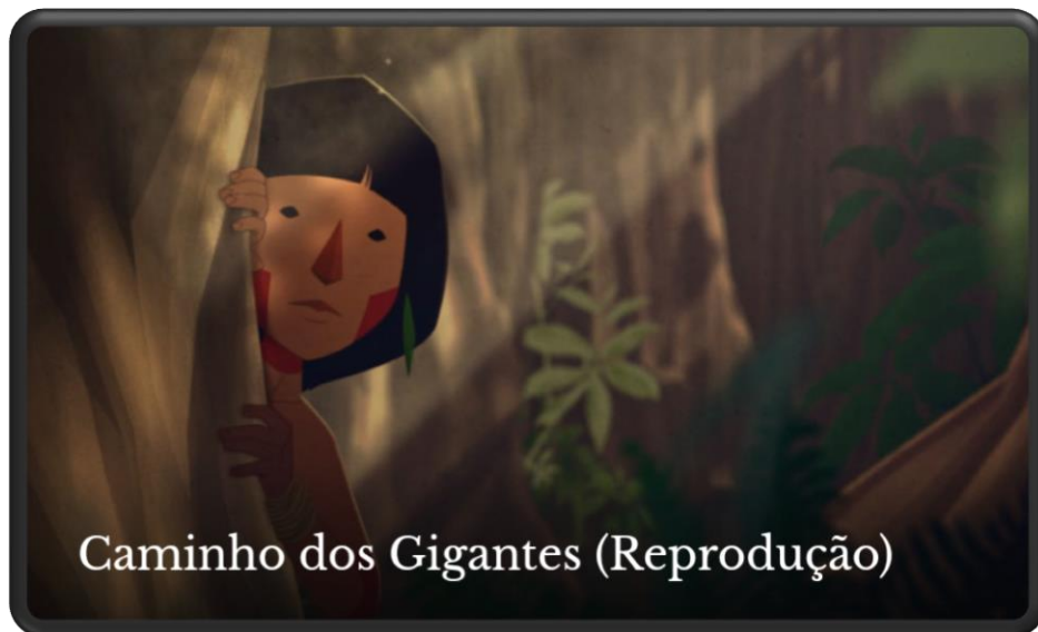
Caminho dos Gigantes (Reprodução)