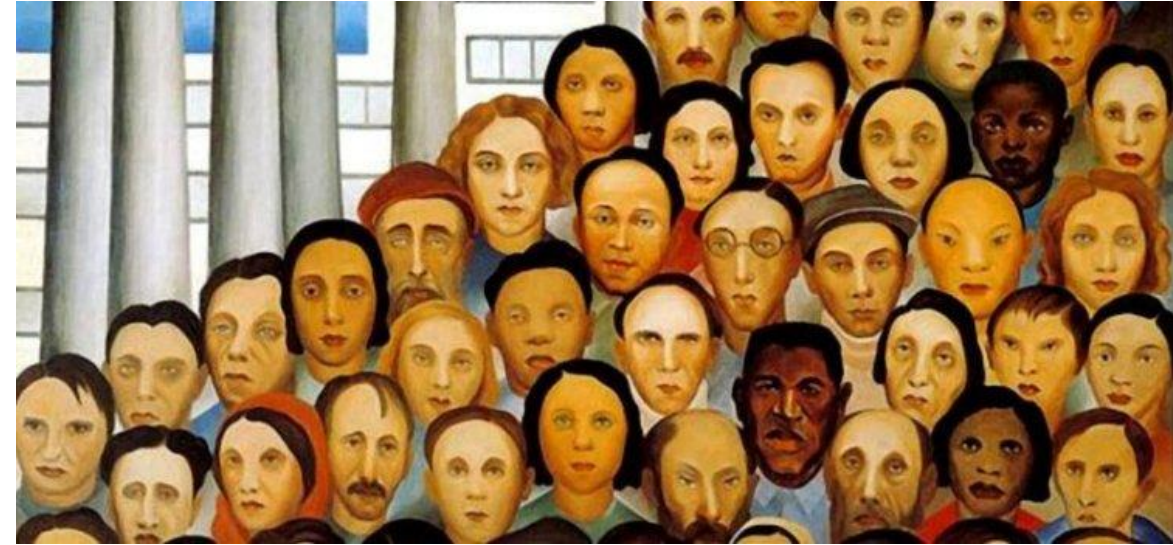
Pintado em 1933, a tela Operários, da artista Tarsila do Amaral. Disponível em: encurtador.com.br/xMXY5 .

A formação da população brasileira, pode ser vista através do olhar de quem já estava nessa terra quando os colonizadores aqui chegaram, os povos indígenas, ou melhor, os povos originários dessa terra. Posteriormente a isso, observamos a chegada dos europeus, e junto, todo o processo de escravização desses povos que aqui já estavam, num primeiro momento, e depois com o tráfico negreiro. Mais a frente temos ainda, o incentivo à vinda de imigrantes europeus e asiáticos ao Brasil. Daí temos a formação do povo brasileiro, um povo de muitas origens, de diversos povos e etnias.