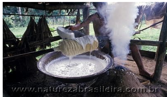
Extração do Látex e produção da borracha na Amazônia

OS ANTIGOS INDÍGENAS PASSARAM A CONVIVER COM OUTROS TIPOS DE CASAS E CONSTRUÇÕES. COM ESSAS DIFERENTES ATIVIDADES, FORAM SURGINDO AS PRIMEIRAS CIDADES EM NOSSO ESTADO.