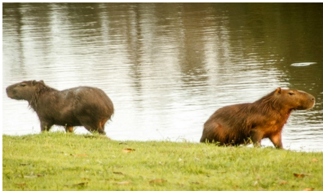
Capivaras - (Foto: Glauco Capper/Asscom Ufac)

PARA INICIAR, VAMOS OBSERVAR AS IMAGENS A SEGUIR: