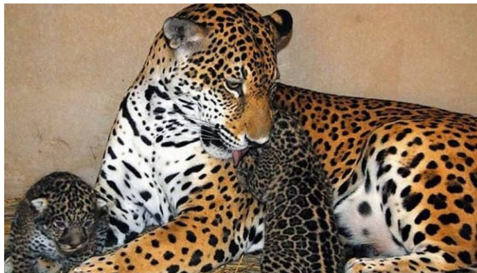
Onça Pintada – Parque Chico Mendes/Rio Branco – ACRE