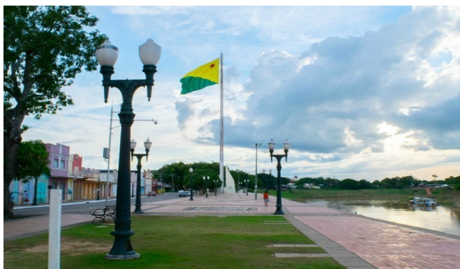
Calçadão da Gameleira