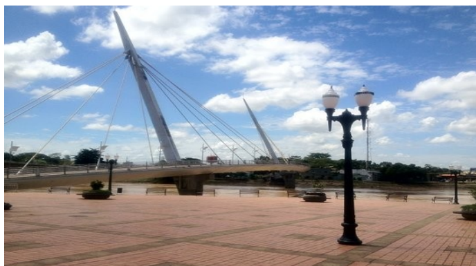
Ponte sobre o Rio Acre