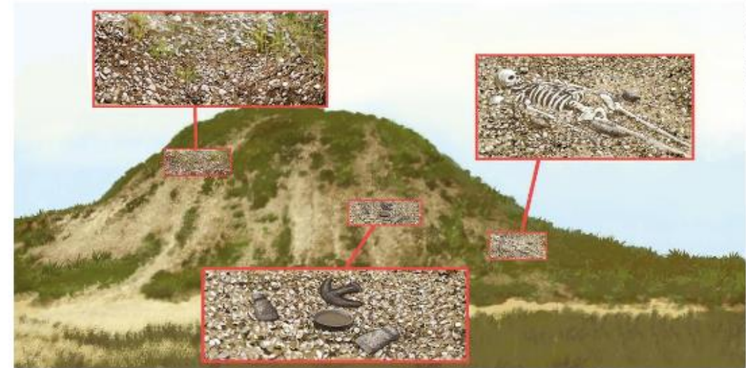
OLIVEIRA, Tânia Regina Ferraz. Estudo comparativo dos sambaquis de Caipora, Lageado e Jaboticabeira I : interpretações acerca da mudança de material construtivo ao longo do tempo. Dissertação de Mestrado. São Paulo: Universidade de São Paulo, 2010; Desvendando os sambaquis. Revista Nova Escola . Disponível em: < https://novaescola.org.br >. Acesso em: 9 ago. 2017.

Em diversos pontos do litoral brasileiro é possível encontrar enormes aglomerados de conchas acumuladas por povos antigos. Esses aglomerados, conhecidos como sambaquis, guardam instrumentos de pedra, restos de habitações e fragmentos de esqueletos humanos. Estudos indicam que os sambaquis brasileiros mais antigos podem ter até 10 mil anos. Alguns deles, como os localizados no estado de Santa Catarina, serviam como local de sepultamento.