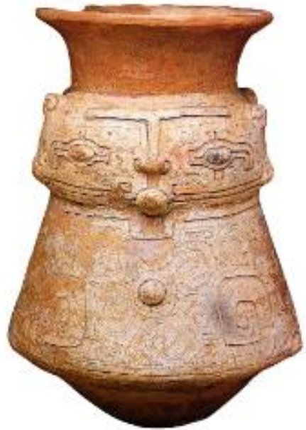
Museu. Arqueologia em Goiás. Brasília/DF: Museu Histórico Nacional do Indígena

Urna funerária feita pelo povo marajoara, que habitou áreas do atual estado do Pará há mais de mil anos.