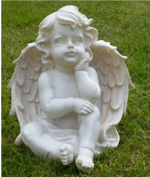
Anjo de jardim