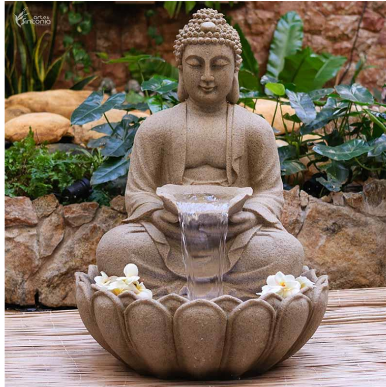
Fonte Decorativa de Buda

https://br.pinterest.com/pin/654077545871971789/