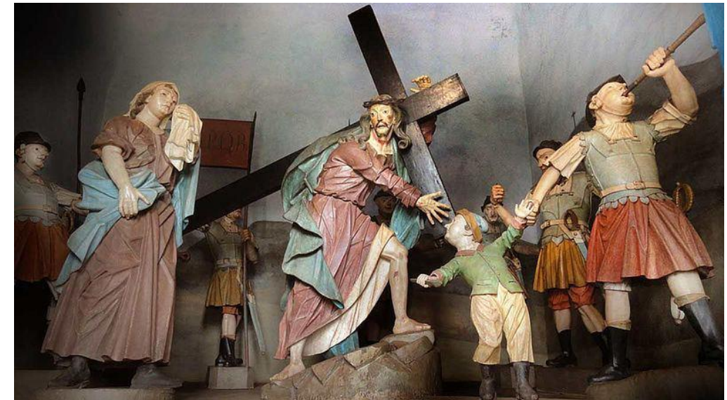
Obra O Carregamento da Cruz (1799), que ficam no adro da Igreja Bom Jesus de Matosinhos.

Fragmento da música Maimbê Dandá Intérprete Daniela Mercury Composição: Carlinhos Brown / Mateus Aleluia